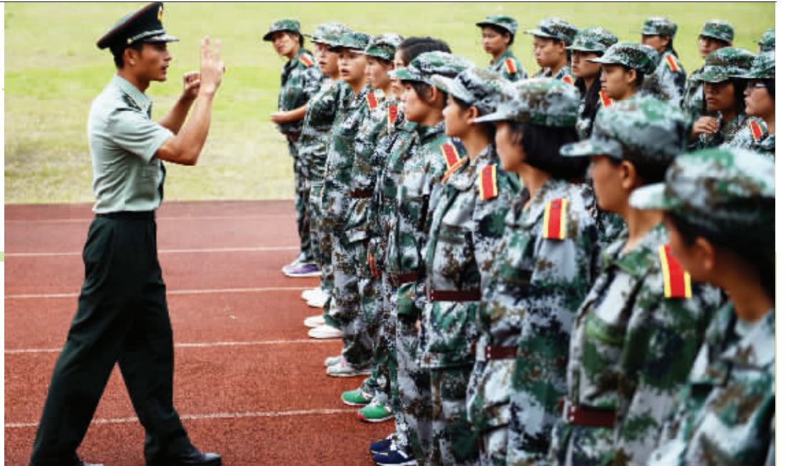
训练场上,教官在用手语教学学员动作,下达指令