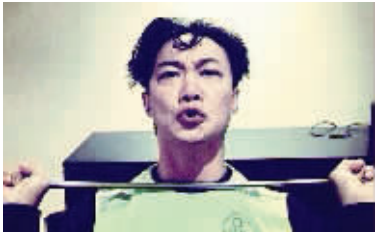
陈奕迅在微博上传了自己“举重”的照片