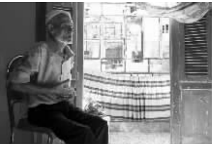
拉姆·胡赛因·阿卜杜拉