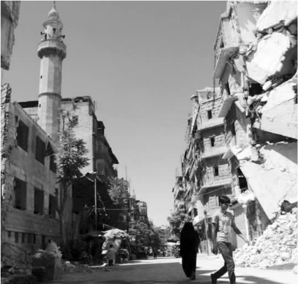
阿勒颇的断壁残垣

从2013年年底的叙利亚政府军进行有系统的轰炸开始,大约90%的居民逃离了阿勒颇,从那以后,有大约2500人在轰炸中丧生。但令人心焦的是,仍有20万—30万的人生活在阿勒颇东部。