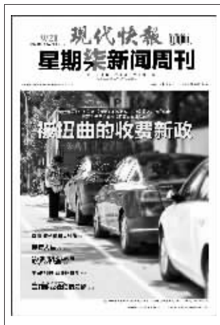
(上周星期柒新闻周刊封面)