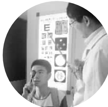
小褚在医院接受检查