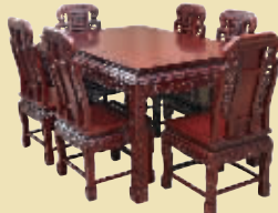
酸枝象头餐台 市场价 18.6 万 钜惠价 3.6 万