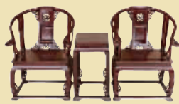
大红酸枝皇宫圈椅 市场价 68 万 钜惠价 14.9 万