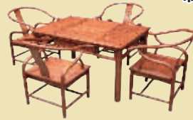
花梨木茶台 5 件套 市场价 5.8 万 钜惠价 6900 元