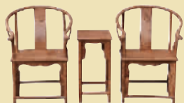
花梨木圈椅 市场价 2.8 万 钜惠价 3900 元