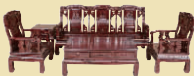
酸枝沙发 市场价 28.6 万 钜惠价 4.9 万