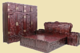
酸枝卧室 7 件套 市场价 48.8 万 钜惠价 8.6 万