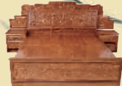
花梨木百子大床 市场价 15.8 万 钜惠价 1.98 万