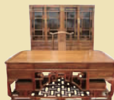
花梨书房四件套 市场价 19.8 万 钜惠价 3.6 万