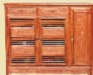
花梨木鞋柜 市场价 4.9 万 钜惠价 7600 元