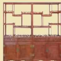
檀香洋花博古柜 市场价 19.8 万 钜惠价 4.7 万