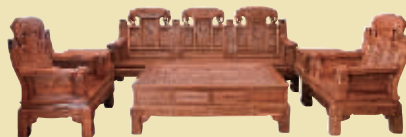
花梨吉祥如意沙发 市场价 16.8 万 钜惠价 2.19 万