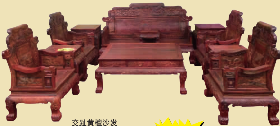
交趾黄檀沙发 市场价 286 万 钜惠价 86 万