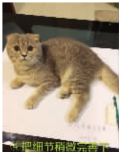
④把细节稍微完善下

回忆专用小马甲:学习立体画转眼已经半年了,主攻画猫,也取得了一些进步。简单给朋友们列出个步骤吧,没啥特别的技巧,就是多练习,祝大家成功!