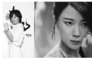
王珞丹在《黄飞鸿》中很帅气

最近柯震东、房祖名纷纷涉毒，让大众对年轻艺人的私生活在巨大质疑。对此，在昨天于乌镇举行的功夫动作片《黄飞鸿之英雄有梦》发布会上，作为主演的彭于晏提到此话题时表示，自己为了保持身材，每天锻炼：“我都没谈恋爱，哪会有空想别的？” 在《黄飞鸿之英雄有梦》中，彭于晏饰演的就是少年黄飞鸿。这一经典形象让彭于晏压力十分大，因此拍戏也格外认真。