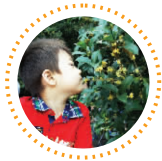
今年的桂花比往年香 通讯员供图