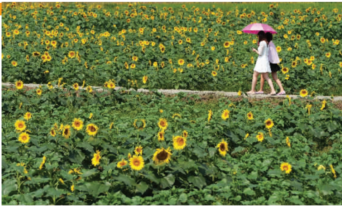
六合钱仓向日葵盛开,吸引了众多游人

周强告诉记者,由于是第一次举办葵花园,停车位、餐饮等配套设施还不够。“葵花海”附近仅有两个小型停车场,车位在120个左右,大多数开车人只能把车停在路边,车辆延伸好几公里。