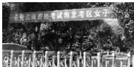
一级建造师资格考试热度不退

有关人士分析,一级建造师、二级建造师、注册监理工程师、造价工程师等国家建筑行业类执业资格考试历年都是考试作弊的重灾区,其原因主要是此类执业资格证书是行业准入的凭证,已在全国建筑行业内部形成了租赁、借用证书获取重大利益的职业链条。