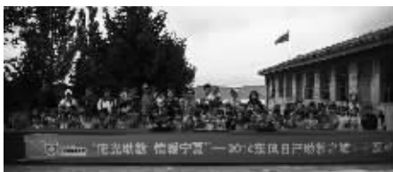
操或去操场跑步。“马湾小学的老师表示。

而九彩乡马湾小学便是海原县的一所小学，也是爱心车队此行的目的地。有50多年历史的马湾小学现有学生78位，学校校舍简陋，课桌椅破旧，教学设备和体育设施比较落后。“最让人头疼的就是孩子们的体育运动了，由于缺乏体育器材，一到体育课，只能让孩子们简单做下广播体