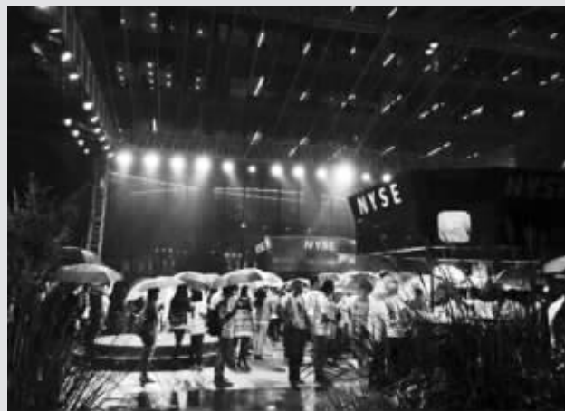
昨晚,杭州,阿里员工雨中观看公司上市直播,他们之中,有不少人一夜暴富

公司自身的创新能力。美国红杉资本主席迈克尔·莫里茨指出,互联网权力格局将因阿里的上市而重新洗牌。“技术世界的权力平衡正从美国倒向中国”。莫里茨说,阿里IPO之后,将成为世界排名第五的最具价值TMT公司(技术、媒体和电信公司)。30年前,排在第50位的TMT公司几乎全部来自美国,但今天,美国的份额下降到了66%,而中国公司则从30年前的微乎其微升至如今的10%。