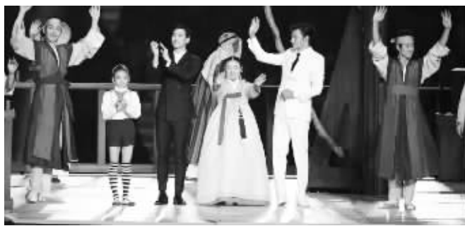
金秀贤(左三)、张东健(右二)

从韩国目前最红的韩剧演员，曾是韩国电视电影节的一哥一姐，到享誉世界的流行歌手，再到目前最炙手可热的演唱组合，每个领域的一线明星都相继登场。在开篇的欢迎仪式中，现场首先回顾了1988年汉城奥运会的经典一幕，一个滚着铁环的七岁小男孩跑进场地中央，这代表了那个时代韩国民众对于大型体育赛事的共同记忆。