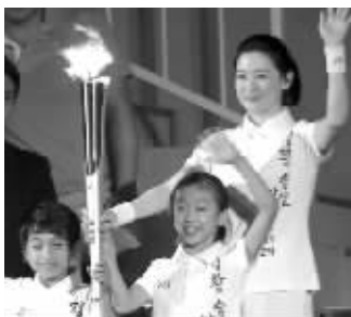
“大长今”李英爱与两位小朋友

亚运组委会最后解释了选择李英爱的原因：致力于向全世界宣传韩国文化的李英爱，通过在中国建立小学等多种多样的社会和慈善活动，传递了亚洲大融合的期望。