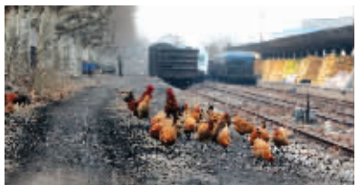
浦口火车站的铁轨一度成了“快乐农场”:一边种菜,一边养鸡

车站一名工作人员称,20多年前,他就听说过,中华门火车站要搬离主城区,迁至燕子门外,但至今没动静。