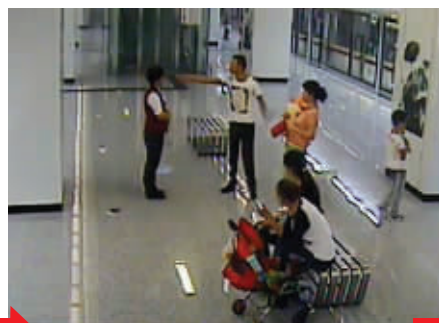
男子辱骂前来劝阻的站务员