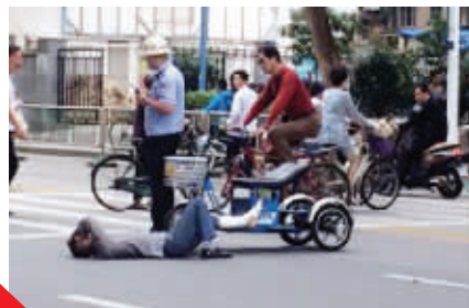
交警赶到现场劝男子离开