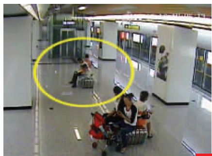
男子抱小孩在站台上小便