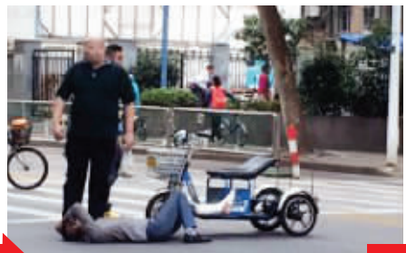
老外好心上前询问