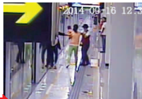
同行女子扇完站务员, 又来撕扯衣服