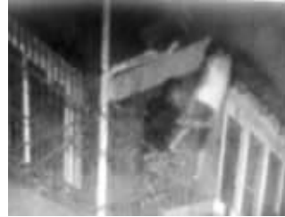
消防队员试图空中救人没有成功