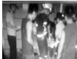
还好,四五名消防队员联手接住