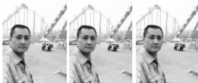
网友“今天长这样”每天都晒三张一样的自拍

爱自拍的人很多，可是能在微博里以自拍走红的却没几个人。网友“今天长这样”是个爱自拍的男人，他每天在微博只干一件事，晒每天的自拍，并且成功走红。