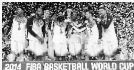
2014 FIBA BASKETBALL WORLD CUP 美国梦之队夺冠很轻松

没有绝对巨星,没有超级冷门,没有热点话题 这场篮球盛会的影响力远远不如男足世界杯 如何提高关注度成国际篮联最头疼的事