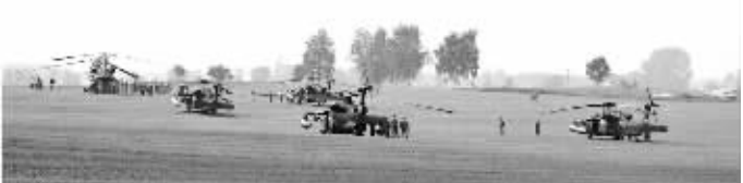
迫降的美军直升机编队