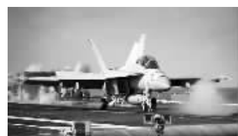
美军“大黄蜂”战斗机 资料图片