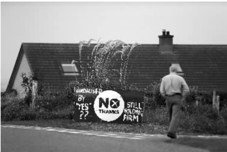
9月12日,在英国苏格兰刘易斯岛的斯托诺韦,一名男子经过反对苏格兰独立的标语