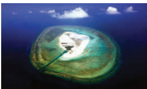
西沙中建岛犹如一片硕大的荷叶