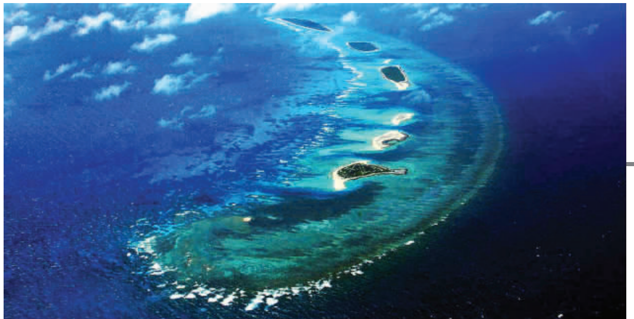
西沙七连屿位于宣德群岛海域