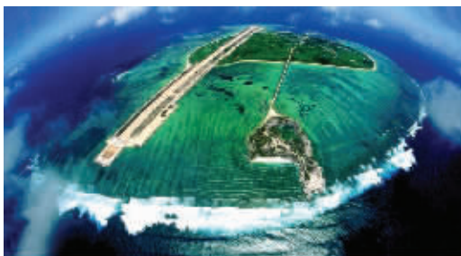
永兴岛是三沙市所在地