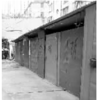
违建车棚上写了“拆”字

“自从房改之后,房子归铁路职工自己,小区就成了无物管小区。”鼓楼区宝塔桥街道的一位副主任表示,后来随着居民停车需求的增加,各家各户就开始搞封闭车棚,结果把一个院子都占得差不多了。“停车问题解决了,但环境变得脏乱差。五六月份的时候,我们