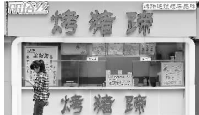
“丽塔丝”门店停止出售烤猪蹄

质监局人员表示,如果是合格的,那么查封的东西会还给对方。但有一点是明确的,由于现场不符合食品加工要求,朱某肯定是不能继续在北固山路小作坊里加工了。