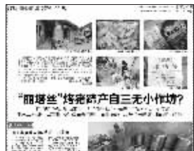
现代快报相关报道