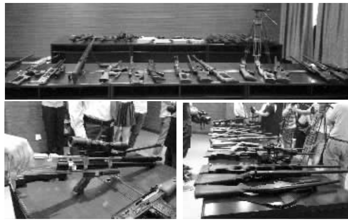
警方缴获的仿真枪

警方还缴获仿真枪68支,电脑2台,汽车1部、银行卡10张;查明非法购买枪支人员200余人,涉及全国20余个省市;通过收网行动新发现非法买卖网络数个。据了解,这些仿真枪要么是买家购得零部件后组装,要么是卖家集齐零部件后组装再出售。