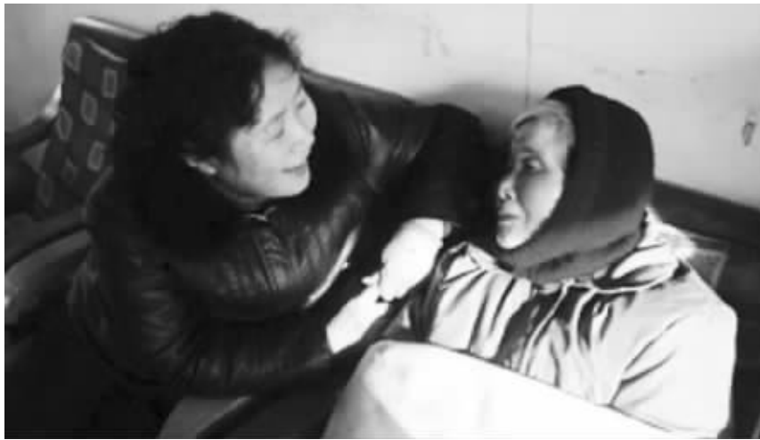
翁阿姨在照顾继母(资料照片)