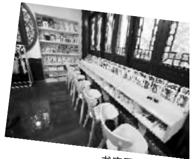
书店里别致的格局