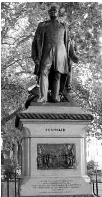
英国探险家富兰克林塑像

加拿大总理斯蒂芬·哈珀9日宣布,在历时6年后,加拿大搜寻人员终于找到了近170年前在北极海域遭遇不测的一艘英国探险船。这艘船属于英国海军将领约翰·富兰克林率领的北极探险船队。哈珀表示,那场近170年前的探险为加拿大在北极部分地区的主权奠定了基础。