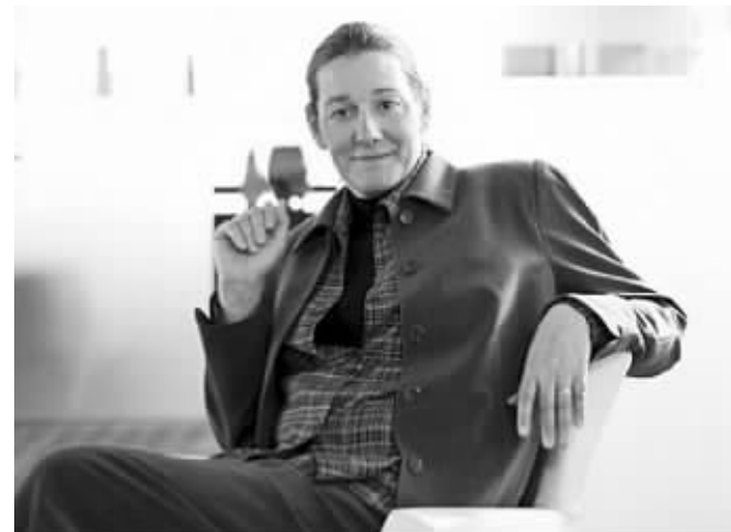
美国最富女CEO罗思布拉特

美国联合疗法制药公司首席执行官玛蒂娜·罗思布拉特,单是去年的收入便高达3800万美元(约合人民币2.3亿元),是当地最高薪的女首席执行官,亦是全球最成功的女商人之一。她近日接受媒体访问,坦言自己原本是男儿身。