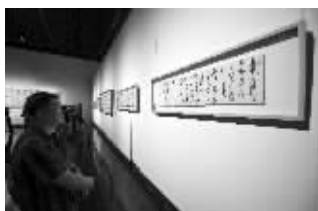
观众认真欣赏黄惇的作品