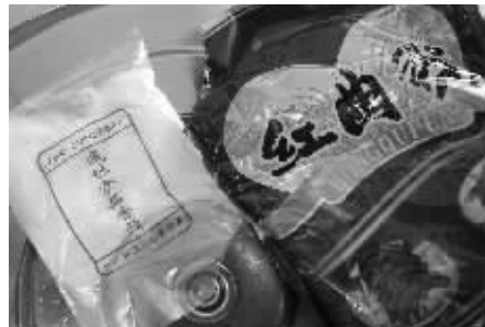
加工所用的添加剂

烤猪蹄如今俨然成了南京市民的新宠,大街小巷随处可见。在湖南路狮子桥步行街、夫子庙等地,都新开了一家叫“丽塔丝”的烤猪蹄连锁,生意非常火爆。不过近日现代快报记者接到投诉,称在南京市北固山路某大院内,有一处猪蹄加工作坊,怀疑涉嫌无证经营。而鼓楼区质监局执法人员现场检查发现,该作坊的确没有证照,而且使用了“三无”添加剂,进一步调查还发现,此处作坊里堆放了大量的“丽塔丝”包装袋,作坊老板承认,与该连锁店存在合作关系。