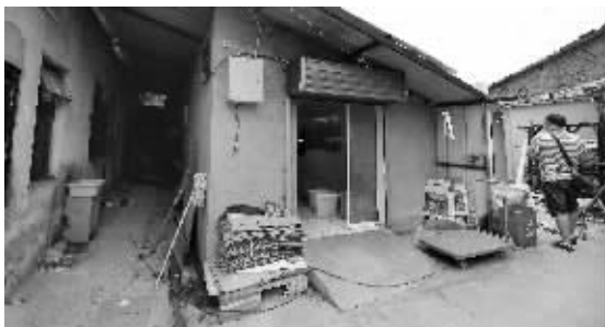
猪蹄加工点藏身简陋民居中