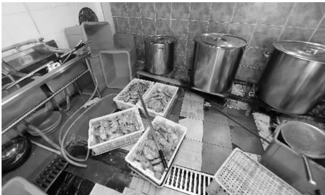
加工现场脏乱不堪

此外,大院内还有别的单位,而且有一处公用的厕所,而绕行到厕所后记者才发现,此处公厕和作坊只有一道临时泡沫板阻隔,实际距离只有三四米远。