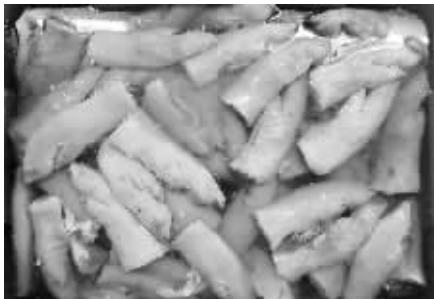
用水泡开猪蹄准备加工