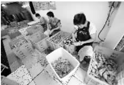
工人们没穿消毒服