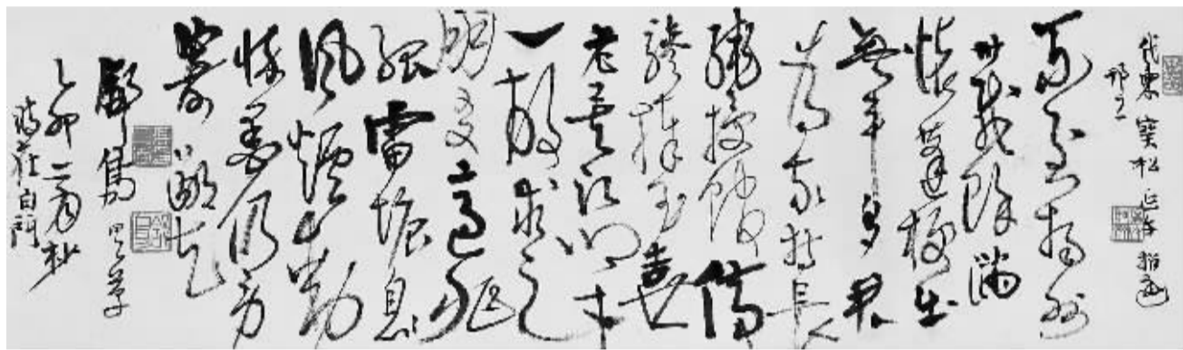
高二适《给宝松延午诗》