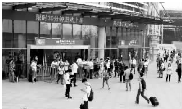
南京小红山客运站限时30分钟进站

昨天中午11点,现代快报记者来到小红山客运站,此时客流量还不是很大。21个售票窗口前排队等候的人并不多,只用排两三分钟就能买到票。而在与地铁相连的负一层,不少市民在自动售票机前用身份证取票,输入密码、刷一下身份证,车票就出来了,非常便捷。“售票窗口增加了,一分钟就把票给买了。”乘客戴先生说。