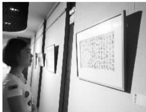
观众在现场观赏刘灿铭作品

9月5日下午,“心·经”刘灿铭写经书法巡展来到盐城图书馆。作为江苏省内巡展的第四站,刘灿铭依然延续第一、二、三站的风格,不设开幕仪式,而是开展了文化惠民的系列活动。开展当天,刘灿铭在展览场馆举办了以“中国书法简史”为主题的讲座,将书法知识送到基层。