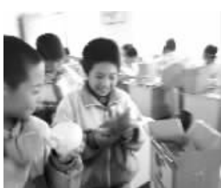
打开爱心包裹,学生们很开心