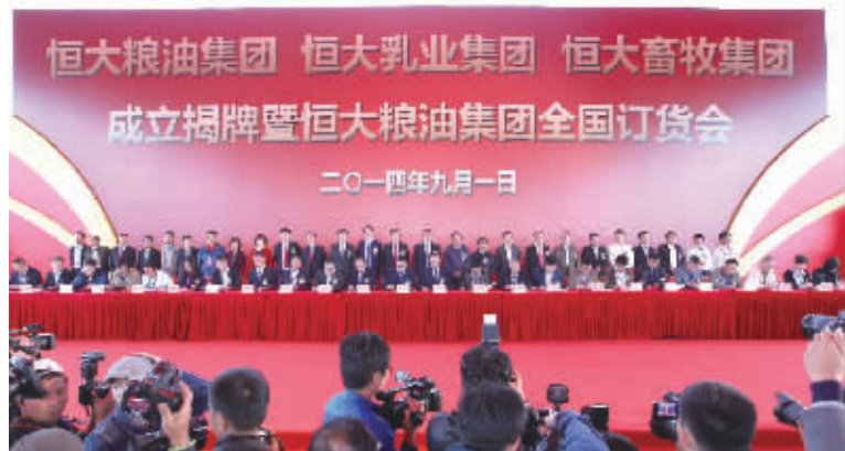
恒大粮油订货会签约现场

9月1日,恒大粮油、恒大乳业、恒大畜牧三大集团成立揭牌仪式暨恒大粮油集团全国订货会在内蒙古阿尔山举行。此次订货会吸引了730个城市3500名经销商参加,全球500媒体全程关注,现场订货金额119亿元,开创订货会订单金额最高、影响最大、品牌最强的行业纪录。