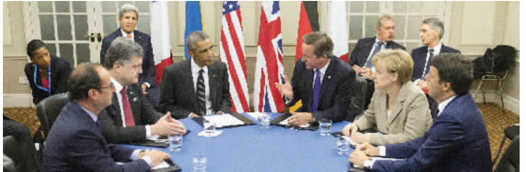
4日,在北约峰会上,(从左至右)法国总统奥朗德、乌克兰总统波罗申科、美国总统奥巴马、英国首相卡梅伦、德国总理默克尔、意大利总理伦齐开会讨论乌克兰局势