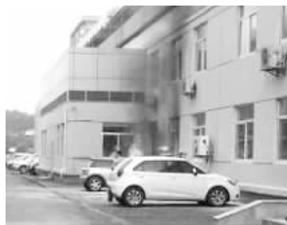
靠近楼房拐角的车冒出黑烟和火光 请供图网友来领稿费

几分钟后,3辆消防车就赶了过来。消防人员用水枪先将车外部的明火扑灭,随后用工具破开车窗玻璃,并打开引擎盖,扑灭车里的火焰。消防部门表示,车辆起火原因还在调查中。