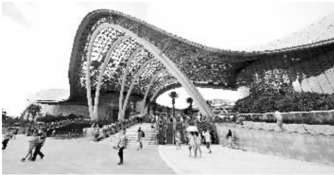
三亚海棠湾免税购物中心外景

现场众多游客表示，现在海南有了世界最大的单体免税店，希望这里的商品种类再丰富一些，价格再优惠一些，真正让游客感受到这里是“购物天堂”。