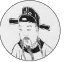
贵八公(明朝) 徐达之孙