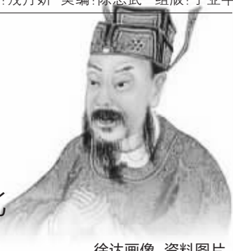
徐达画像 资料图片