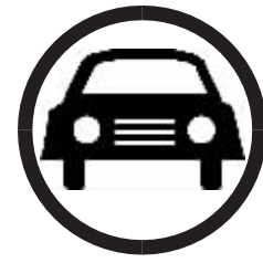
公职人员违规用 车,常被老百姓举报