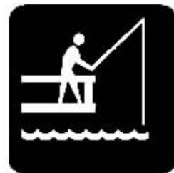
钓鱼也夹杂着腐败