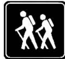
旅行也成纪委防腐热点