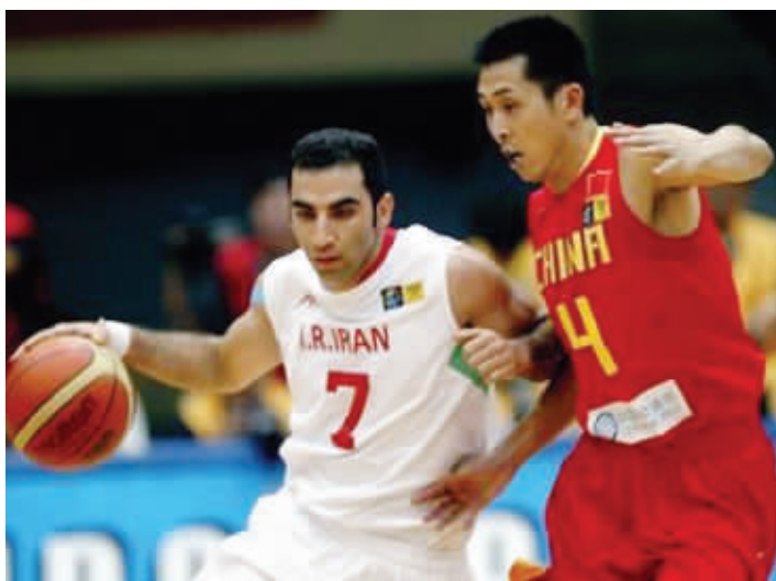
卡姆拉尼(左)曾让中国男篮吃尽苦头

对于《亚篮网》报道的同曦已经和卡姆拉尼签约的消息,同曦俱乐部高层昨天在接受记者采访时作出了回应:“不久前,有经纪人向我们推荐了卡姆拉尼,他的能力毋庸置疑,在近几年的亚洲赛场上,他也让我们的控卫吃到了苦头,但目前