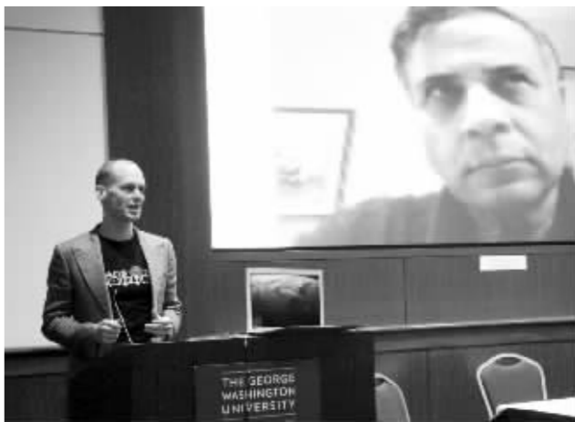
巴斯·兰斯多普创办的这一项目吸引了全世界人的目光

能不得不学会如何对自己进行手术治疗。”候选人之一根特说。但是在仔细考虑后,他不得不承认,更实际一点的做法是在需要时协助病人自杀。这就是现实,殖民地的生活是和地球完全脱离关系的,做出这些