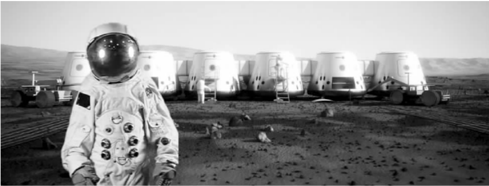
火星上的生活(假想图)

根特认为参加这样的项目是有点疯狂的,对于别人的嘲笑他都表示接受。人类早期时代,也总会有一些怪人坐在海滩上凝望大海,最终人类开启了大航海时代。“那时候谁要是有关航海的想法,其他人也一定认为他是疯子。”根特说。