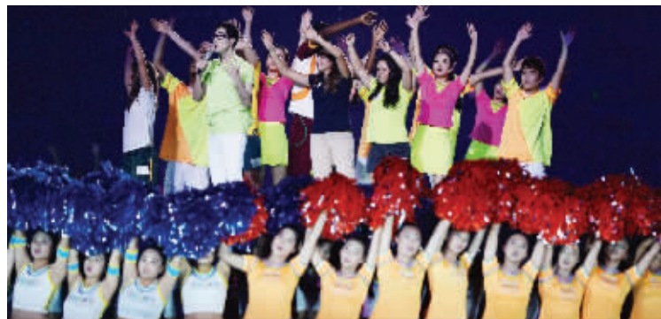
闭幕式上,尽情地唱,尽情地跳