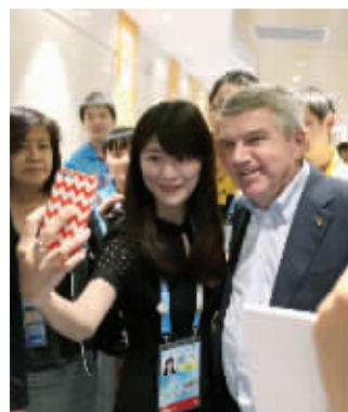
昨天的发布会后,巴赫被围堵求合影

“自拍很好玩,我很喜欢。”昨天下午国际奥委会举行新闻发布会,巴赫坦言,真没想到自拍引起那么多人的共鸣。最初是在国际奥委会的讨论会上,奥委会的宣传主任亚当斯萌生了自拍的念头。“我当时还在想在这样的场合,我能不能自拍呢。”巴赫说,后来确定自拍后,就在想是