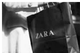
ZARA已成为年轻人钟爱的时尚品牌 资料图片