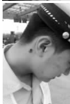
左图:路中间的隔离带上趴满了蜜蜂 右上图:收费站室外工作人员戴面罩防蜜蜂 右下图:一只蜜蜂趴在民警的脖子上