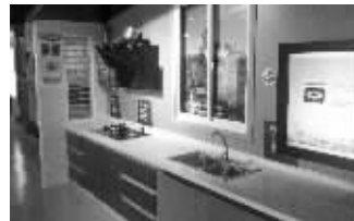
生命安全体验馆内景

“如果发生了煤气泄漏,第一选择是报警吗?”很多人都回答错了。正确答案是:不能打电话,也不能