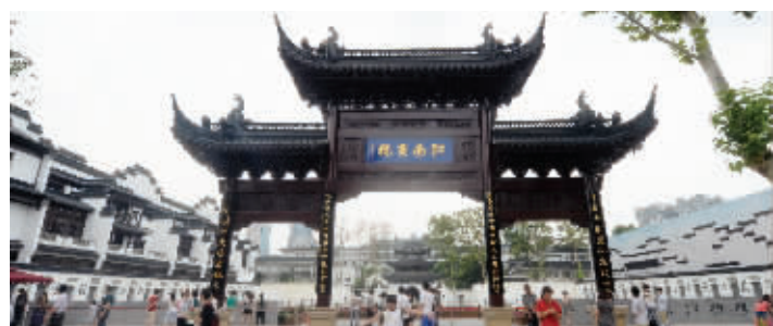
昔日江南贡院,今日变身为中国科举博物馆