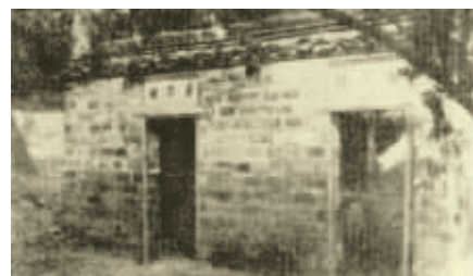
清代时江南贡院内的号舍 资料图片