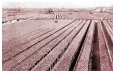
江南贡院曾有考试号舍20644间 资料图片

眼下这个季节,正是古代学子赶考的时候,每三年举行一次的江南乡试在农历八月初进行,又称作秋闱。多年寒窗苦读的学子能否加官进爵,鲤鱼跃龙门就看这一回了。位于南京秦淮河畔的江南贡院,作为乡试考点之一,每到此时也就进入最热闹的季节,大江南北的学子纷至沓来。