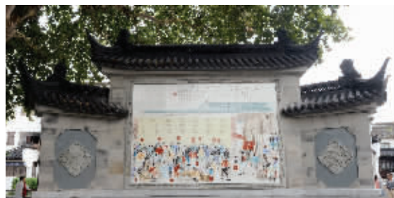
江南贡院内,有一个过去张贴皇榜的大照壁,照壁上的瓷画,描绘当年科考放榜的景象