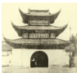
民国时的明远楼 资料图片