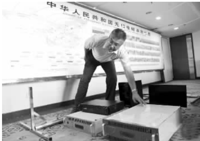
查获的功率达到8000瓦的“黑广播”设备

据业内人士分析,“黑广播”的影响半径为300公里范围,也就是半小时的航程,正是飞机起降降落最危险的阶段。如果地面完全听不见呼叫,飞机有可能处于“失联”状态,造成严重后果。