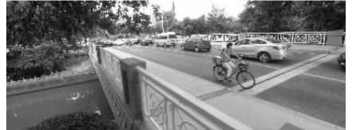
汉府街东延工程中新建的跨河桥

汉府街东延工程已经竣工近1个月,一座跨河桥的正式通车,缓解了逸仙桥至中山东路白街路口的交通拥堵。不过,相关部门还没给这座桥命名。