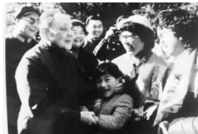
中山陵 1985年2月,邓小平在中山陵与群众在一起