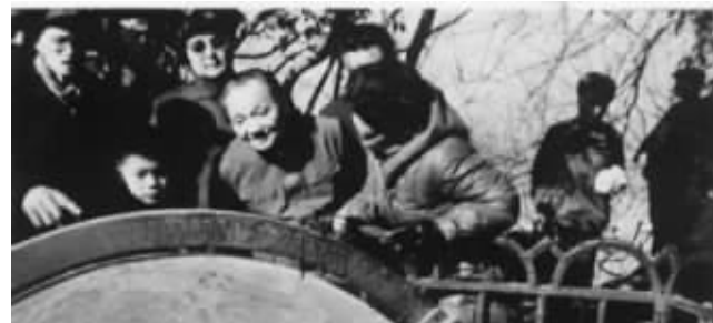
紫金山天文台 1985年2月,邓小平视察紫金山天文台