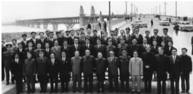
长江大桥 1975年4月,邓小平陪同金日成率领的朝鲜党政代表团在南京长江大桥合影