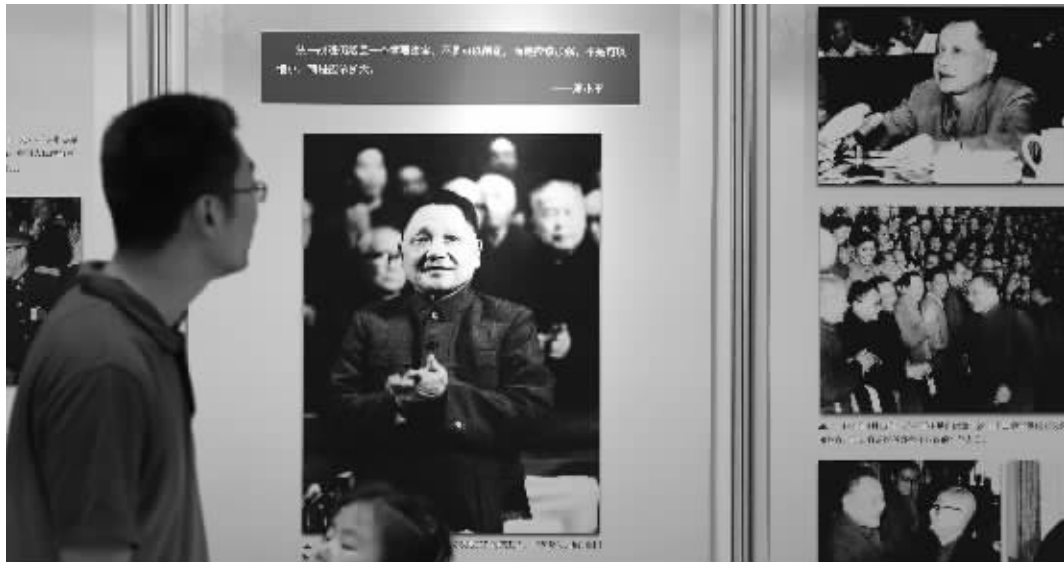
8月22日,“邓小平同志诞辰110周年图片展”在南京梅园新村纪念馆正式开展