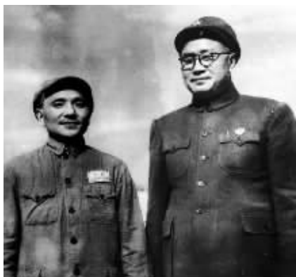
1949年邓小平与刘伯承在南京