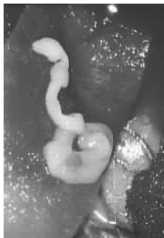
取出的虫子在显微镜下显得有些惨人